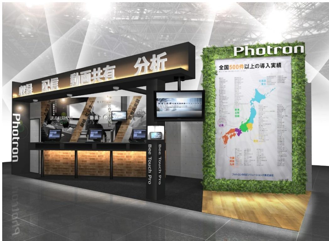
フォトロン M&E ソリューションズ ブースイメージ

https://www.photronmandesolutions.co.jp/news/190529_edict2019.html