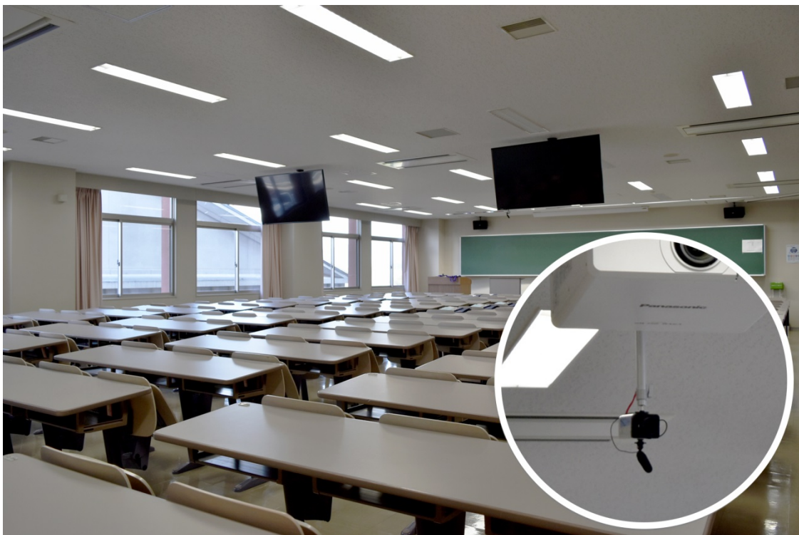
広島国際大学 講義室と各教室に設置されたネットワークカメラ/指向性マイク

https://www.photronmandesolutions.co.jp/education/case/hirokoku.html